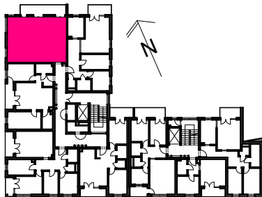
Położenie mieszkania w budynku. Rzut 1 piętra w skali 1:800